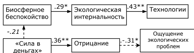
Рисунок 2. Модель осмысления глобальных экологических изменений в группе «Д-1» (связи значимы при p < .1 , кроме * - p < .01 , ** - p < .001 ). \chi^2/df=4,5/10 ; p=.89 ; RMSEA 0; GFI .99.

и ослабляющая биоцентрическую оценку ситуации (это следует из результатов корреляционного анализа и подтвердилось путевым анализом). Проверка регрессионной модели (в качестве регрессоров рассматривались смысловые диспозиции и мотивационные типы ценностей) показала, что личная актуальность экологических проблем в этой группе не связана с биосферным беспокойством, зато зависит от ценностей универсализма, т.е. осмысление глобальных экологических угроз как актуальных обусловлено здесь альтруистическими побуждениями.