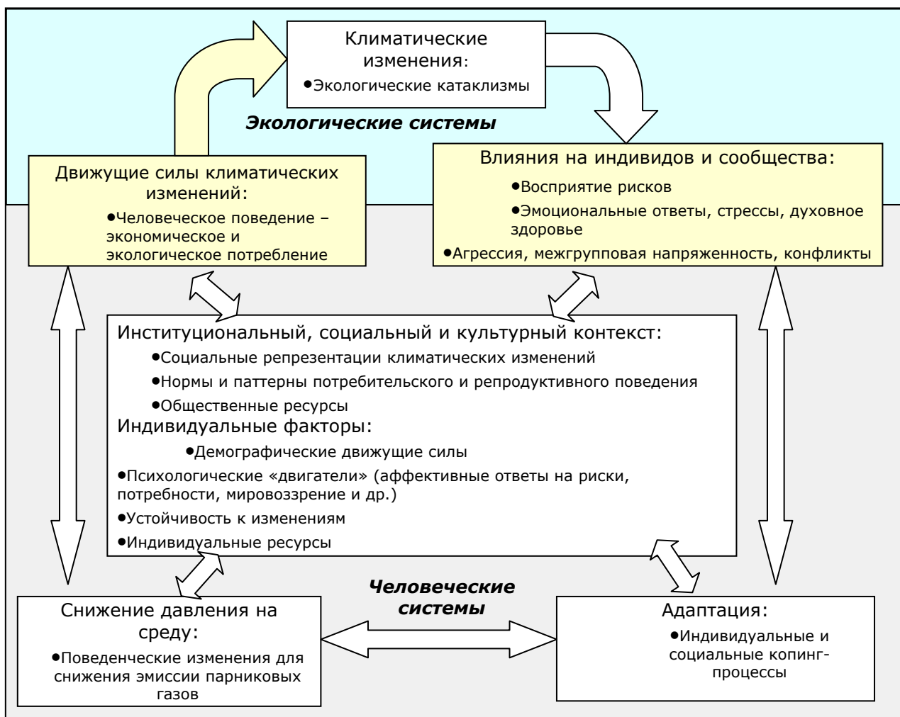
Рис. 1. Психологические аспекты антропогенных климатических изменений: движущие силы, влияния, ответы (приводится по: [3, 30])

психологической ассоциации «Психология и глобальные климатические изменения», подготовленном в 2010 г. [3]. Ведущими инвайронментальными психологами была предложена модель психологического анализа антропогенных климатических изменений, раскрывающая взаимообусловленность состояния экологических систем и человеческих систем (рис. 1).