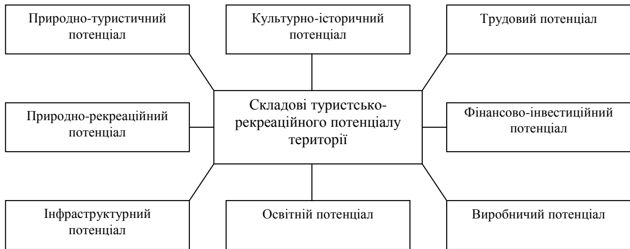
Рис. 1. Складові туристсько-рекреаційного потенціалу території (авторська інтерпретація)

Таким чином, потенціал розвитку туристсько-рекреаційної діяльності території може бути представлений наступними окремими видами потенціалу та ресурсними можливостями території, які можуть бути залучені до господарської діяльності: природно-рекреаційним і природно-туристичним потенціалом, культурно-історичним потенціалом, виробничим потенціалом, трудовим потенціалом, фінансово-інвестиційним потенціалом, освітнім потенціалом, інфраструктурним потенціалом (рис. 1) тощо.