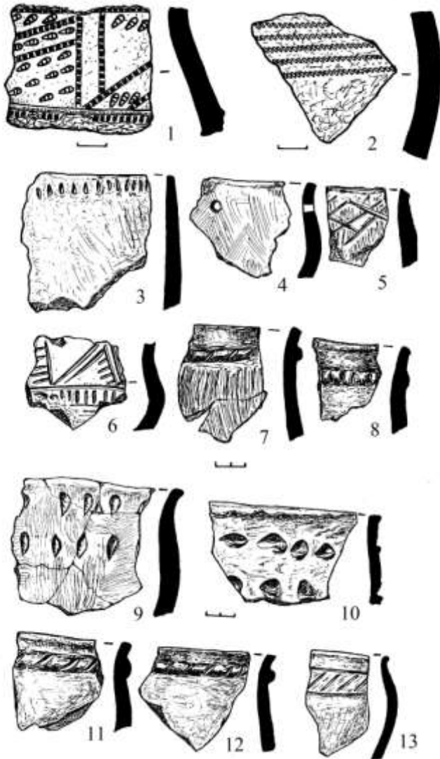
Рис. 1. Кераміка зрубної культурно-історичної спільноти