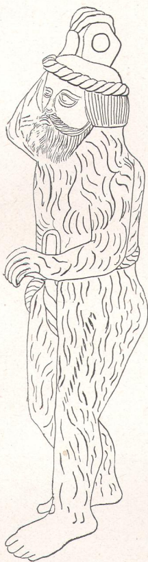
Рис. 6. Статуэтка, хранившаяся въ Кунсткамерѣ Академіи Наукъ.