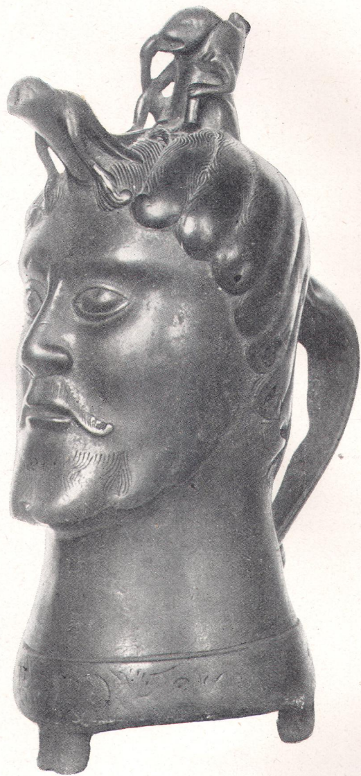
Рис. 4. Водолей Императорского Эрмитажа.