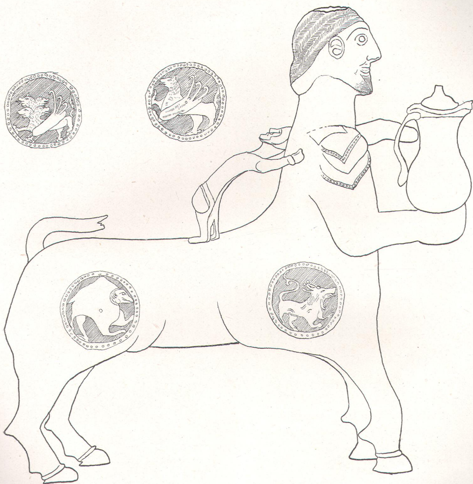
Рис. 5. Водолей, хранивший въ Кунсткамерѣ Академіи Наукъ.