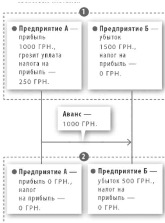
Рис. 3. Минимизация налога на прибыль с помощью авансовых платежей

По оценкам ГНАУ, благодаря «двухсобытийности» в 2009 г. в бюджет не поступило около 4,2 млрд. грн. Понятно, что предоплата должна производиться предприятием, которому грозит уплата налога на прибыль, в пользу предприятия, которому светят убытки. Дополнительным бонусом использования схемы является формирование налогового кредита по НДС.