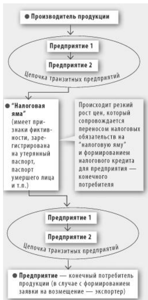
Рис. 1. Формирование «левого» налогового кредита и минимизация НДС с помощью «налоговых ям»

Лидером среди применяемых в целях минимизации налоговых обязательств остается схема, основанная на использовании т.н. «налоговых ям»