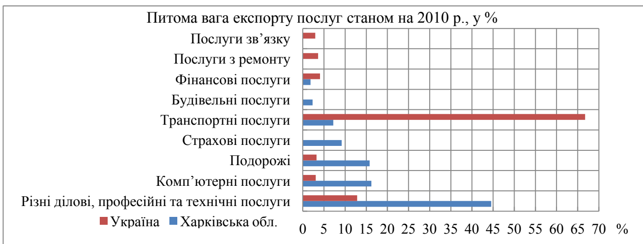
Рис. 3. Структура експорту послуг підприємствами України та Харківської обл. зокрема, у 2010р., у %