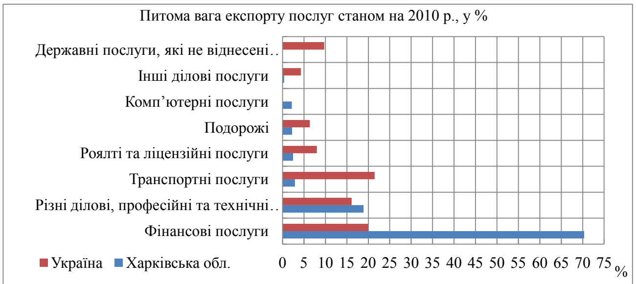
Рис. 4. Структура імпорту послуг підприємствами України та Харківської обл. зокрема, у 2010р., у %

В результаті проведеного дослідження можна сказати наступне: