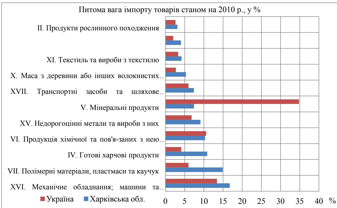
Рис. 2. Структура імпорту товарів підприємствами України та Харківської обл. зокрема, у 2010 р., у %