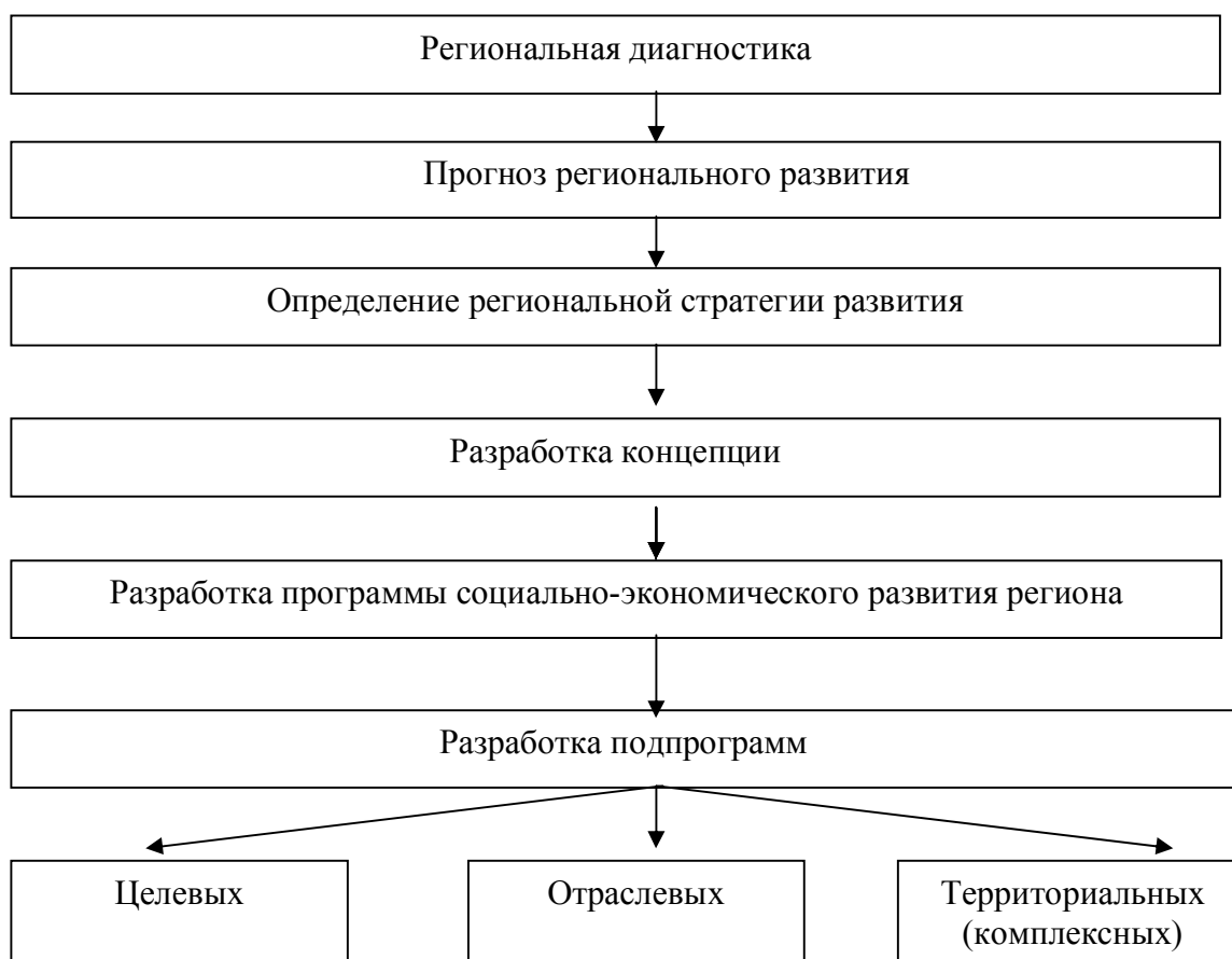
Рис.2. Структурно-логическая схема научно-технических основ разработки конструкции регионального развития (по А.П.Голикову и Н.А.Казаковой [1 ])

Помимо создания в районах Западного Китая полюсов роста, территориально-производственных комплексов, экономических кластеров, «коридоров роста», а также интенсификации его межрайонных торгово-экономических и производственных связей с экономически развитыми районами Восточного и Центрального Китая, возможно внедрение прочих рычагов подъема производительных сил региона. К ним следует отнести успешно апробированный в КНР опыт создания специальных экономических районов, «открытых городов», приграничную торговлю и проч.