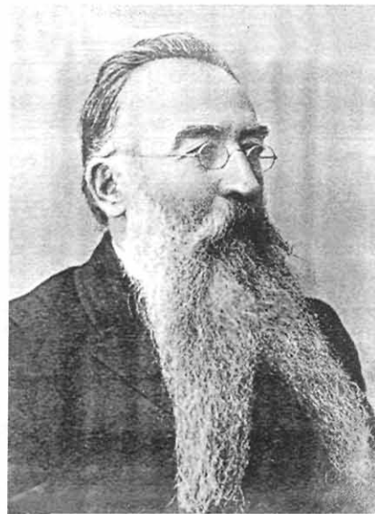
Н. Н. Каразин, начало XX в.

К окончательному утверждению в своих предположениях привело нас изучение документов В. Н. Каразина. В «Формулярном списке о службе» (14 июня 1829 г.) В. Н. Каразин в графе о наличии