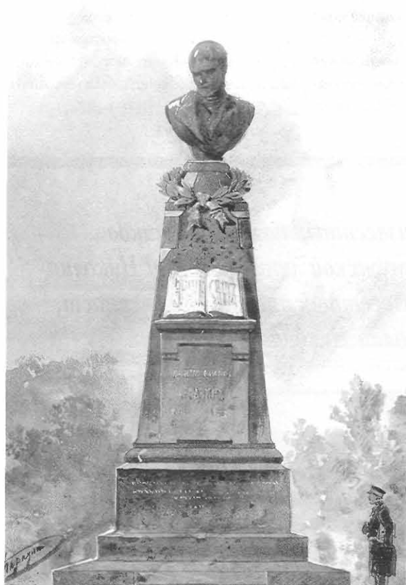
Проект памятника В. Н. Каразину. Авт. Н. Н. Каразин, 1904

Практически неизвестна, но очень интересна непосредственно связанная с историей Слобожанщины, Харьковского университета вторая родовая ветвь Каразиных, родоначальником которой был брат создателя университета Иван Назарович Каразин. Об этом — в следующем номере журнала.