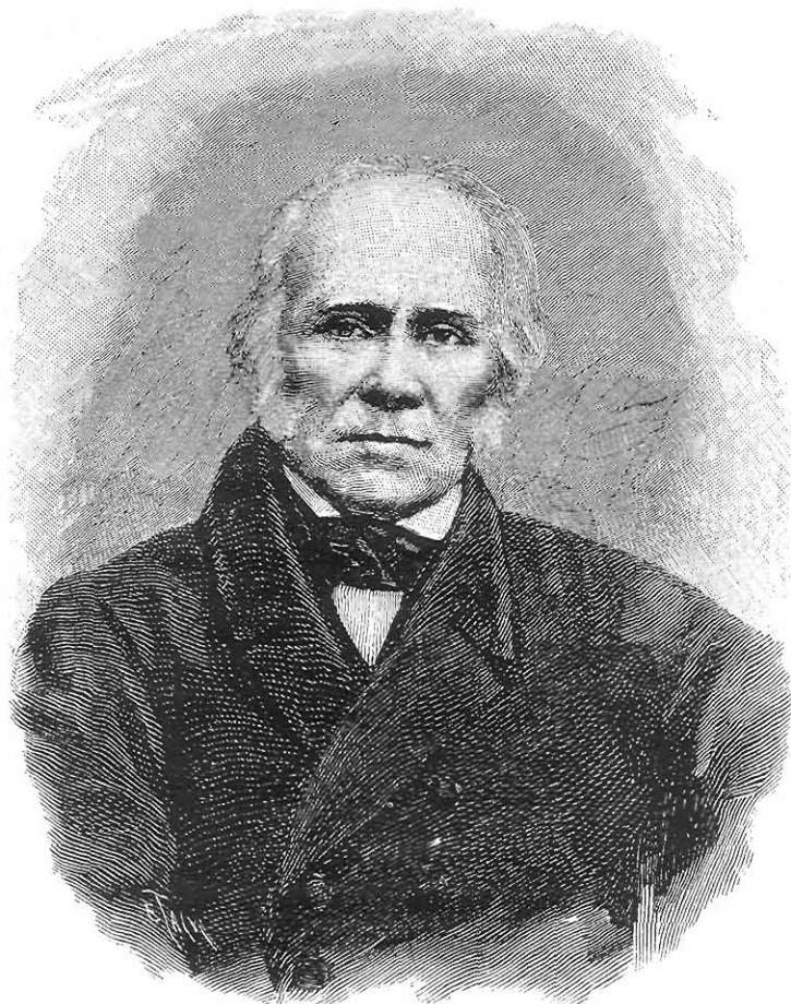
В. Н. Каразин

Присвоение Харьковскому университету имени Василия Назаровича Каразина, приближающийся 200-летний юбилей университета вызывают все больший интерес к личности его создателя.