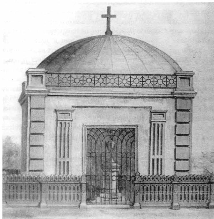
Скелп над могилой В. Н. Каразина, XIX в.

Автор шести романов, многих повестей, рассказов, очерков, Н. Н. Каразин сам иллюстрировал свои произведения. В 1904–1905 гг. вышло его 20-томное