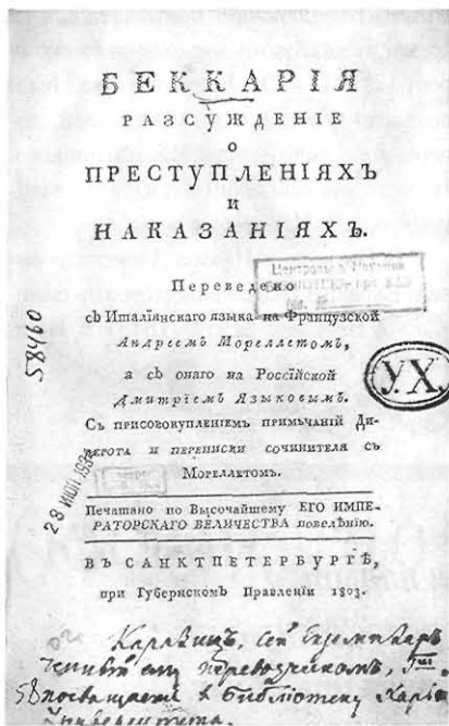
Подарок В. Н. Каразина библиотеке Харьковского университета с автографом