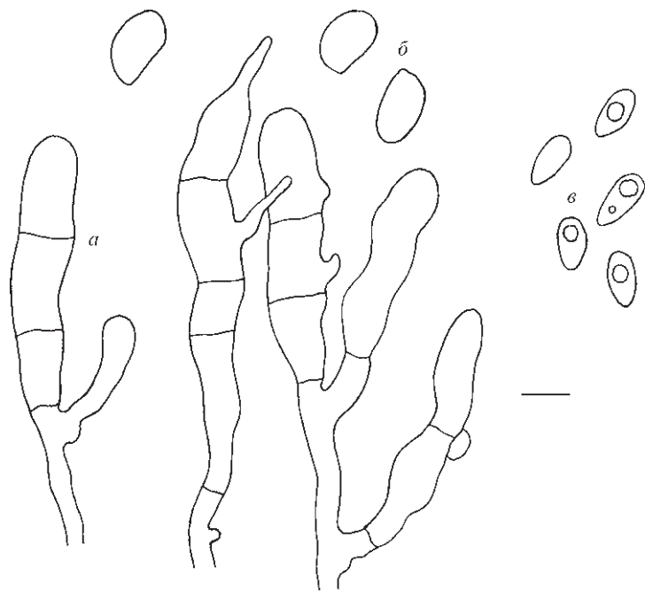
Рис. 1. Colacogloea peniophorae (CWU(Мyc) 4008): — a — базидии, b — базидиоспоры, c — конидии (масштаб — 5 мкм).