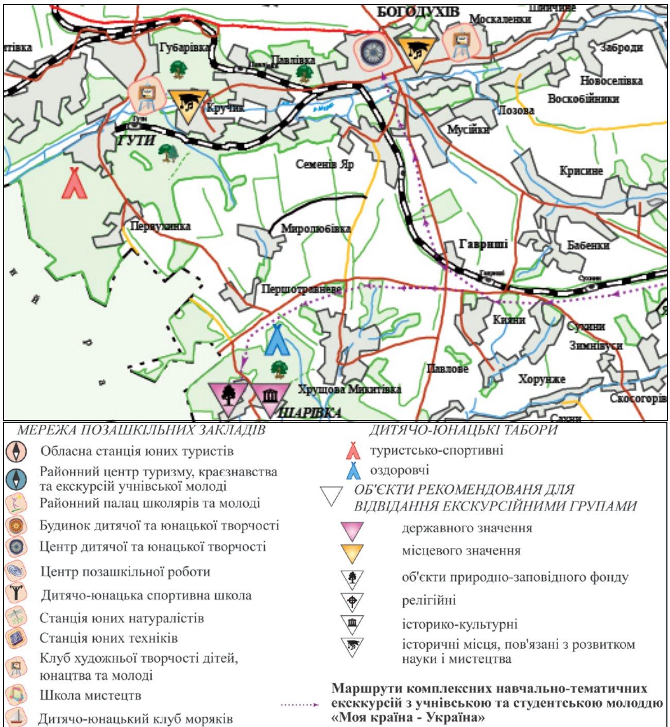
Рис.2. Фрагмент і легенда карти-врізки «Туристсько-краєзнавча діяльність» комплексної туристсько-краєзнавчої карти Богодухівського району, 1: 250 000.

Комплексні туристсько-краєзнавчі карти адміністративних районів Харківської області в електронному вигляді являють собою сукупність тематичних шарів з позначення загально-географічного та тематичного змісту, що дозволяє користувачам регулювати навантаження карт залежно від поставлених завдань.