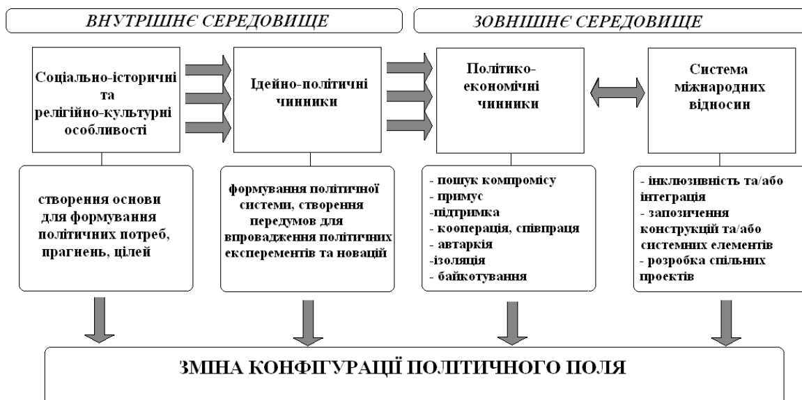
Рис 1. Домінанти дискурсу трансформацій політичних режимів в країнах Близького Сходу

Спочатку спробуємо розкрити соціально-історичні та релігійно-культурні особливості соціокультурної домінанти окресленого вище дискурсу. Історично так склалося, що більшість східних країн у різний час ступили на шлях колоніального (залежного, напівколоніального) переходу до капіталізму, тим чи іншим чином потрапивши під вплив Заходу. Так розпочався процес модернізації під зростаючим впливом Європи, що призвело до суперечливих зрушень у суспільній свідомості. Для найбільш далекоглядних правителів та частини інтелектуальної еліти східних суспільств була незаперечною військова, фінансово-економічна, політична слабкість регіону. Тож для протистояння могутній Європі треба було засвоїти її знання та досвід, бо саме в освоєнні секретів військово-промислового та науково-технічного потенціалу Заходу, на їхню думку, вбачався єдиний шанс здобути перемогу над супротивником. Нові функції східних суспільств у системі світового господарства спричинили трансформацію соціально-економічних структур та прийняття нових правил гри в умовах ринкової економіки, що вимагали нового мислення та конструктивних рішень для специфічних проблем регіону.