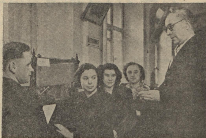
На фото: Студенти 4 курсу біофаку на великому практикумі «Гідрофауна моря». Заняття проводить доц. О. Д. Масловський.

Л. ГЕЛЬФЕНБЕЙН, методист біологічного факультету.