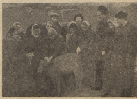
На зимових канікулах за командировкою обласного комітету комсомолу група наших студентів — учасників художньої самодіяльності — виїжджала з концертами в Близнюківський район Харківської області. На фото (зліва направо): 1. Перед від'їздом на Харківському вокзалі; 2. З Близнюків виїхали на двох автомашинах...; 3. Іноді пасажери мінялися своїми ролями з машиною. 4. На тваринницькій фермі колгоспу ім. «Правди» студенти зацікавилися молодняком. (Див. нарис «Зустрічі з колгоспниками» на 4-й сторінці).