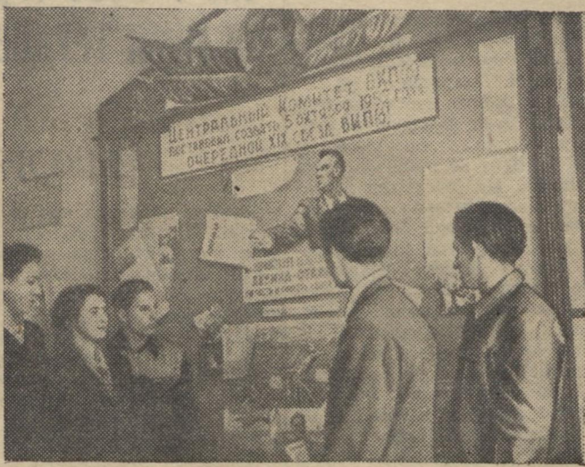
Стенд з передз'їздівськими матеріалами на філологічному факультеті.