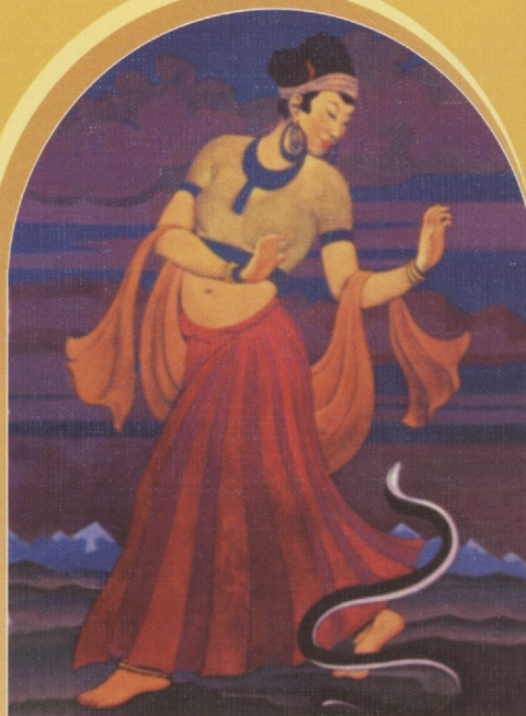
С. Н. Рерих. В поисках мудрости. 1938. Холст, темпера. США, частная коллекция