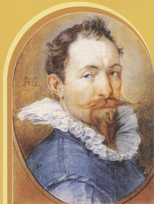
Гольциус Хендрик. Автопортрет. XVI в. Рисунок карандашами трех цветов. Альбертина, собрание графики, Вена, Австрия