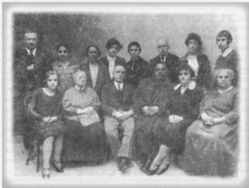
В. И. Невский с группой сотрудников Государственной библиотеки СССР им. В. И. Ленина. 1929 г.

22 января 1935 г. в «Правде» появляется статья Невского «Гениальный вождь», посвященная выходу в свет XXVI Ленинского сборника. В ней не было ни строчки о Сталине, и это имело для автора тяжелые последствия. Владимир Иванович был вызван в партколлегию КПК и исключен из партии. 19 февраля 1935 г. по нелепому обвинению в руководстве антипартийной группой он был арестован, и 25 мая 1937 г. на закрытом судебном заседании Военной коллегии Верховного Суда СССР В. И. Невский был приговорен к расстрелу. 26 мая приговор