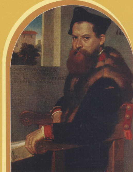
Морони. Портрет Бартоломео Бонги. XVI в. Холст, масло. Музей Метрополитен, Нью-Йорк, США