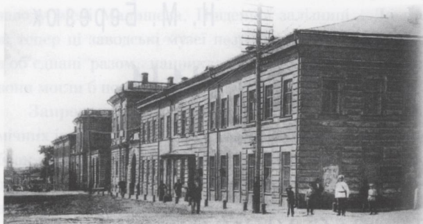
Здесь начиналась история университетской библиотеки. Университетская горка. 1905 год