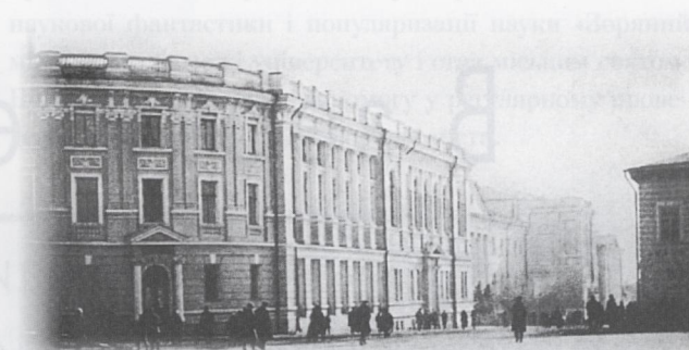
Здание библиотеки (архитектор В. В. Величко). 1902 год

В книге слово «впервые» многократно повторяется. И это понятно. Многолетняя, кропотливая работа позволила впервые воссоздать неизвестные события, даты,