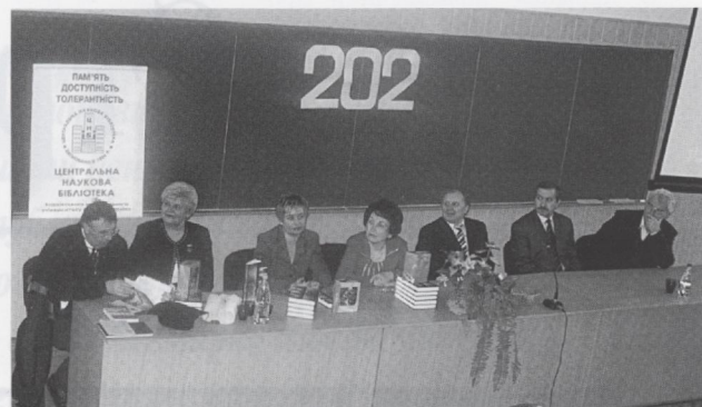
На презентации книги.