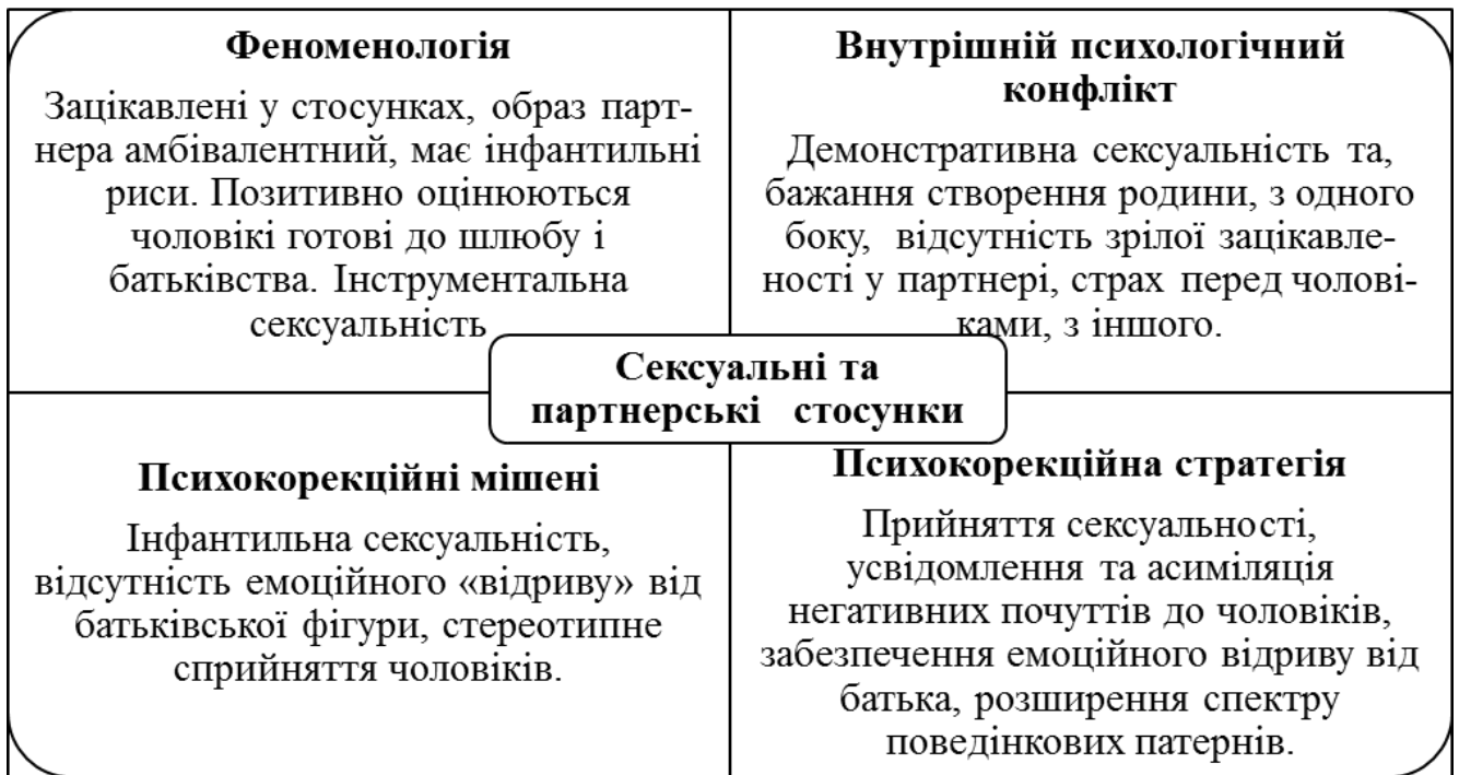
Рис. 3. Інтегративна модель психодіагностики та психокорекції континуально-альтернативної структури особистості у жінок (сексуальні і партнерських стосунки)

Інтегративна діагностично-психокорекційна модель, яка базується на отриманих емпіричних даних може бути рекомендована для використання у практичній психологічній діяльності.