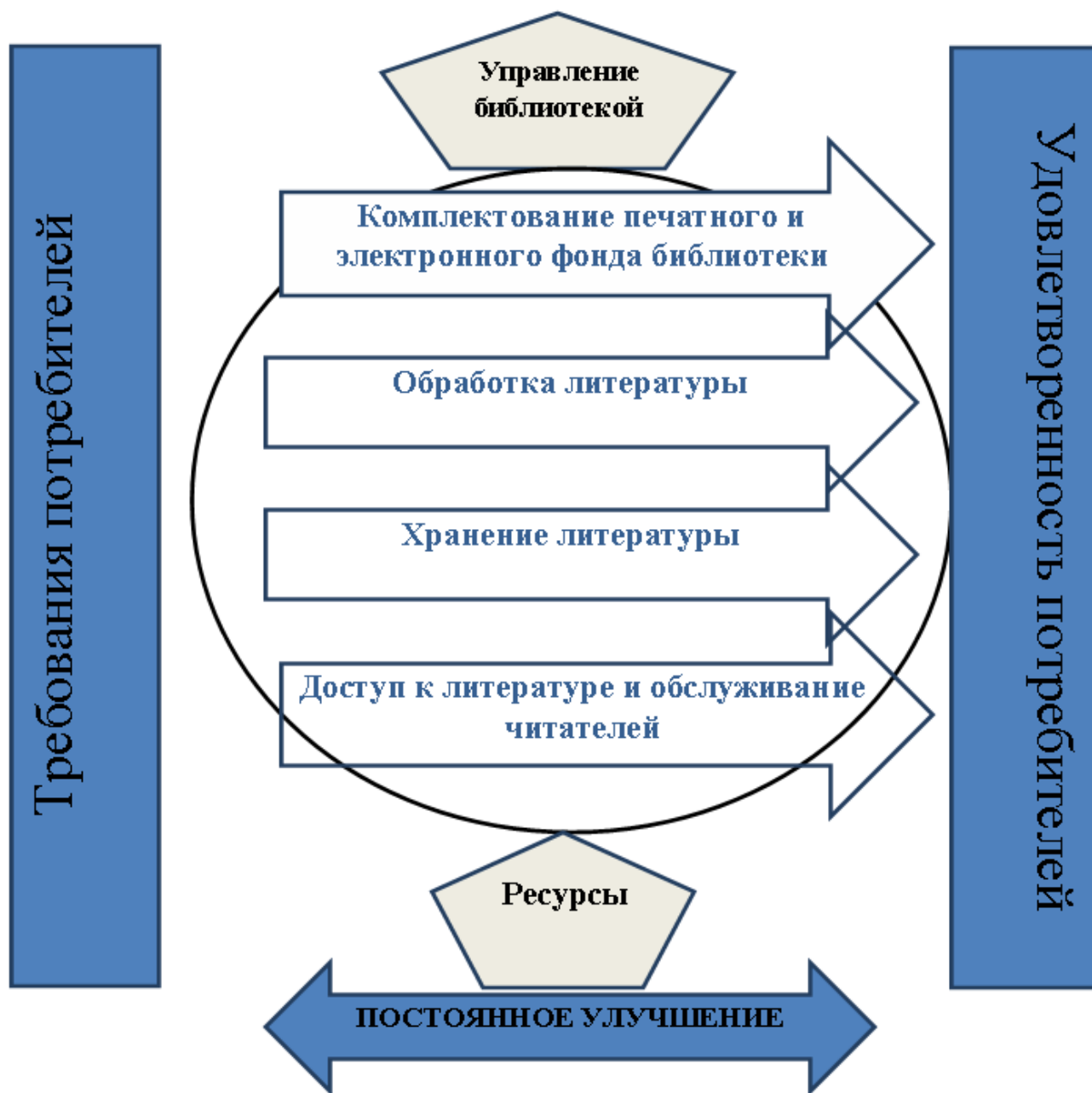
Рисунок 2 – Обобщенная модель процессов, происходящих в библиотеке